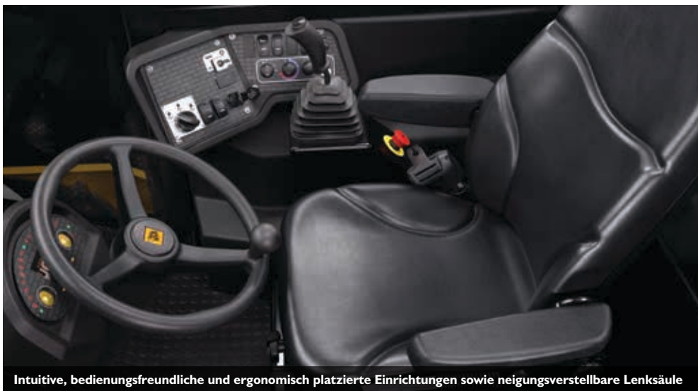
Intuitive, bedienungsfreundliche und ergonomisch platzierte Einrichtungen sowie neigungsverstellbare Lenksäule