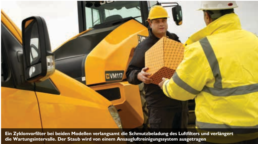
Ein Zyklonvorfilter bei beiden Modellen verlangsamt die Schmutzbelastung des Luftfilters und verlängert die Wartungsintervalle. Der Staub wird von einem Ansaugluftreinigungssystem ausgetragen