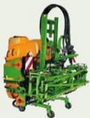
Feldspritze UF, 900/1200 Liter