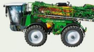
Selbstfahrer Pantera 4000 Liter, 24 bis 40 m