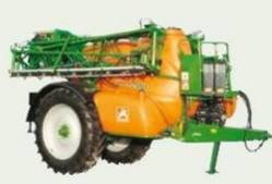
Feldspritze UX, 3200/4200/5200/6200/11200 Liter