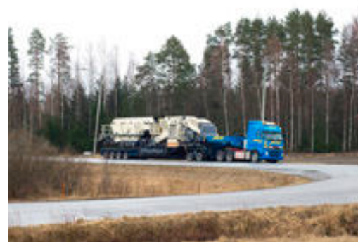
Des dimensions compactes facilitent le transport.