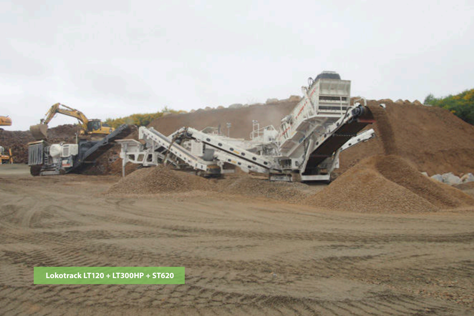
Lokotrack LT120 + LT300HP + ST620