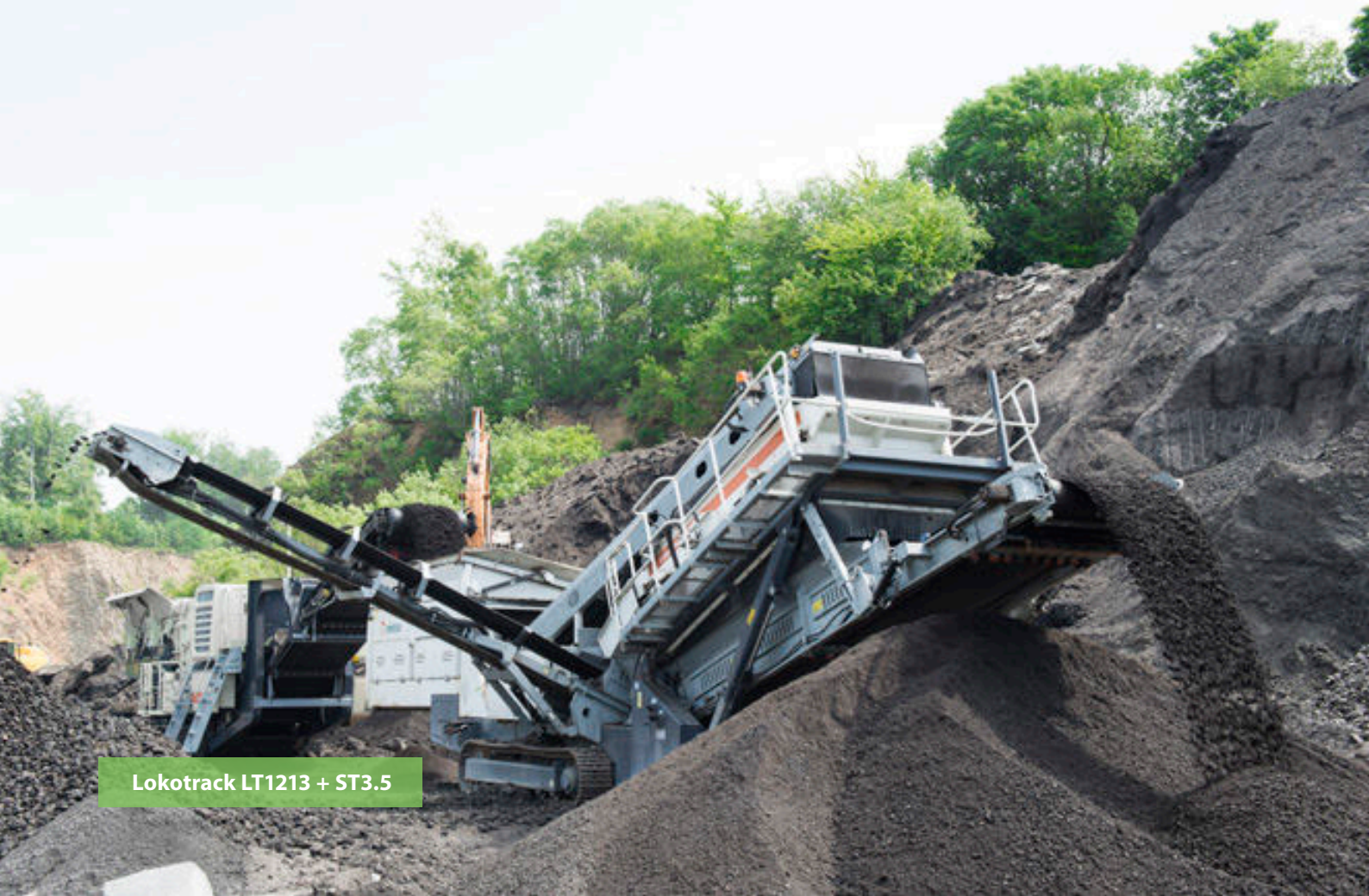
Lokotrack LT1213 + ST3.5