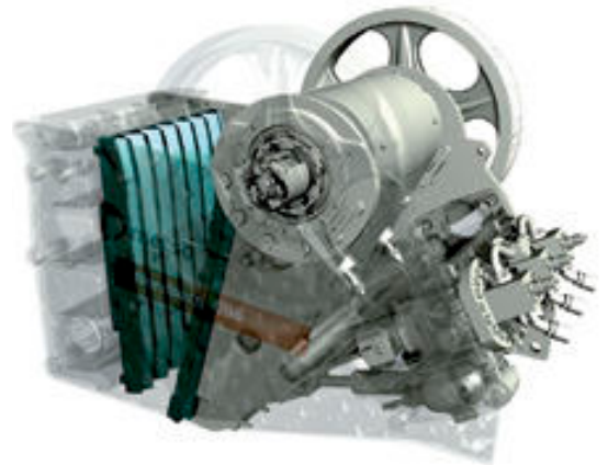
Concasseur à mâchoires Nordberg C96 avec système de réglage hydraulique.