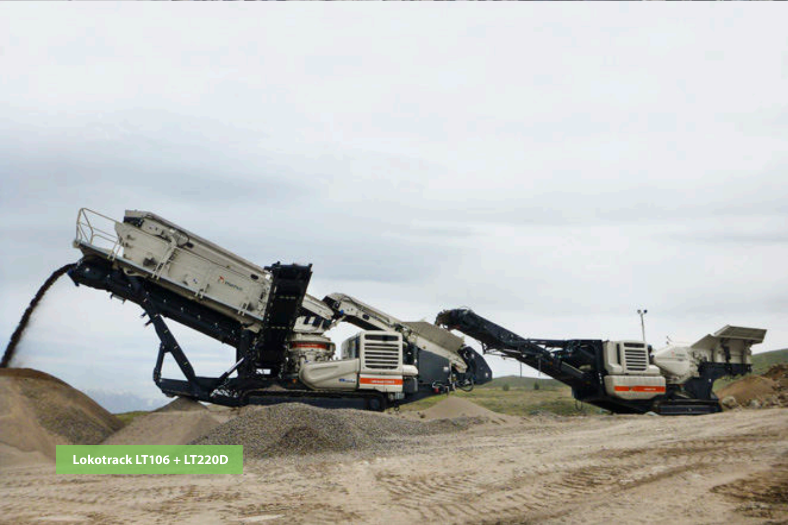
Lokotrack LT106 + LT220D