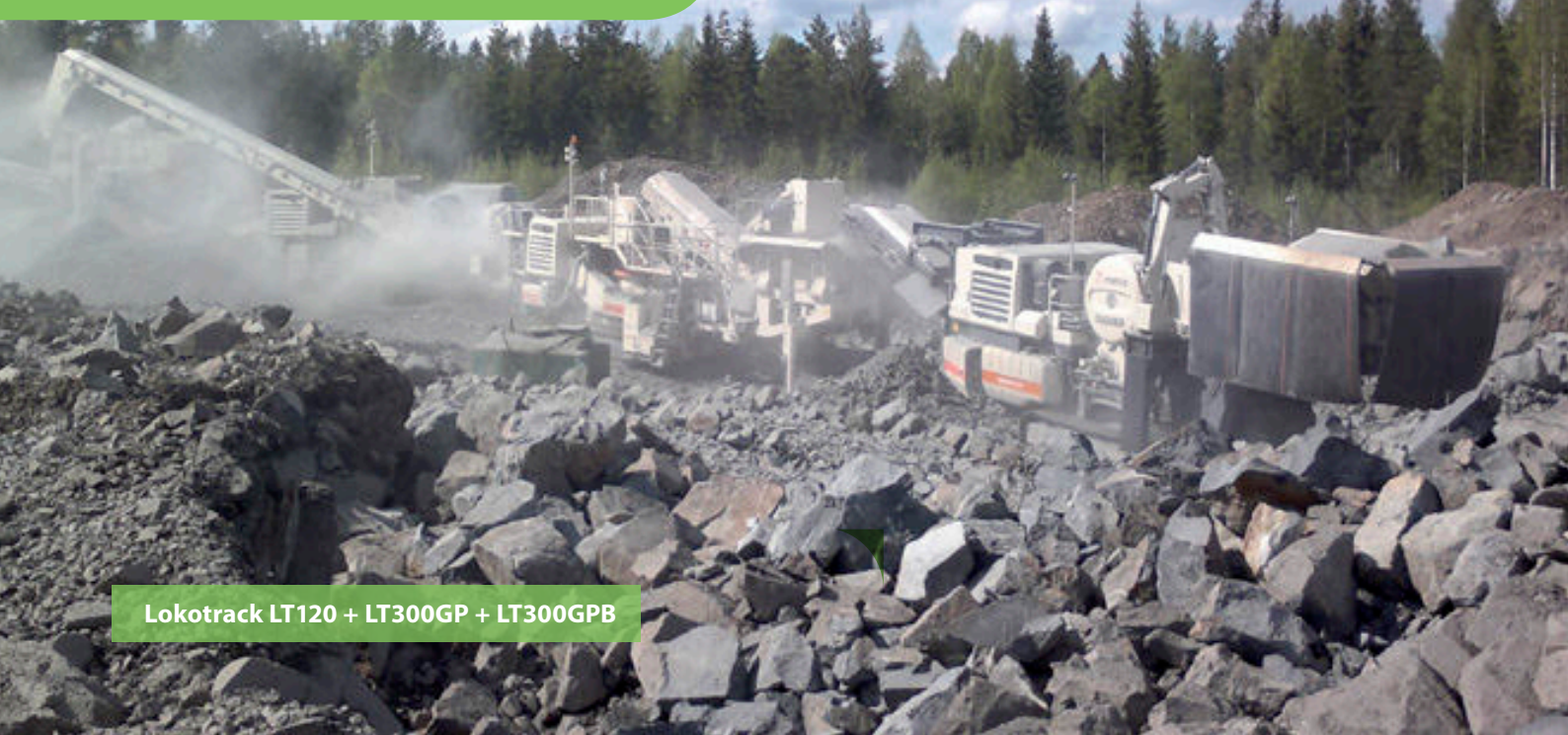
Lokotrack LT120 + LT300GP + LT300GPB