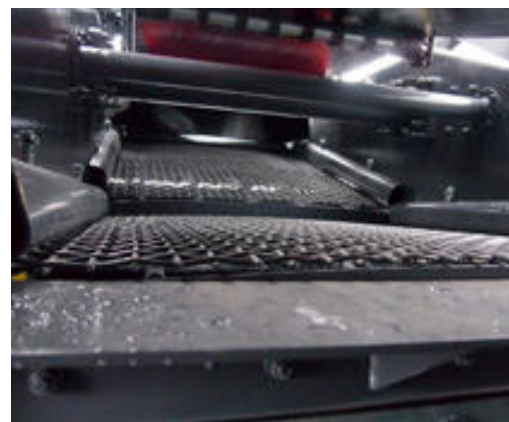
Le crible à double pente permet une séparation efficace et précise des matériaux.