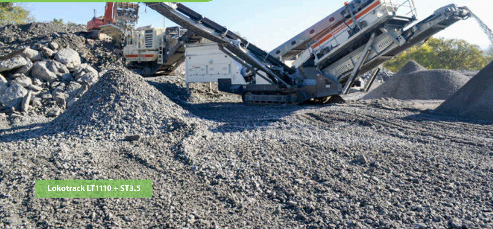
Lokotrack LT1110 + ST3.5