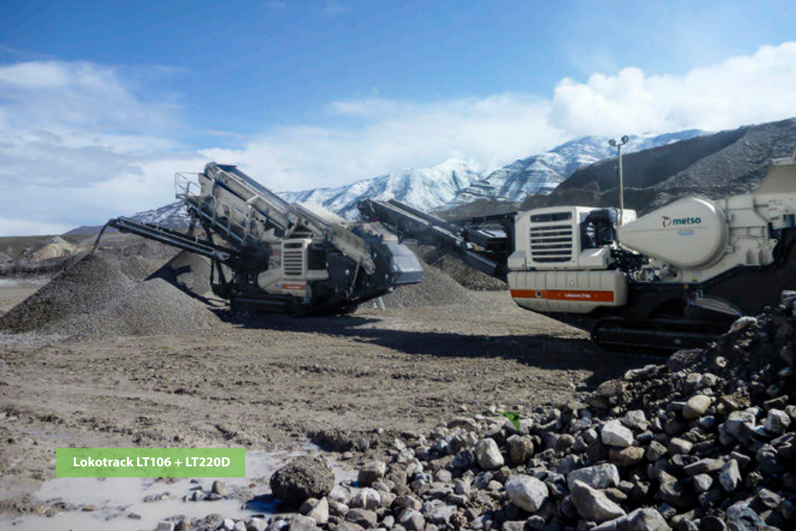
Lokotrack LT106 + LT220D