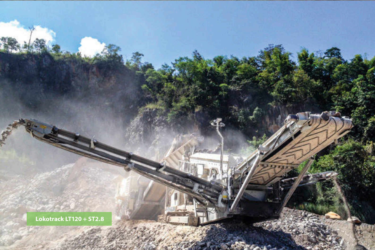
Lokotrack LT120 + ST2.8