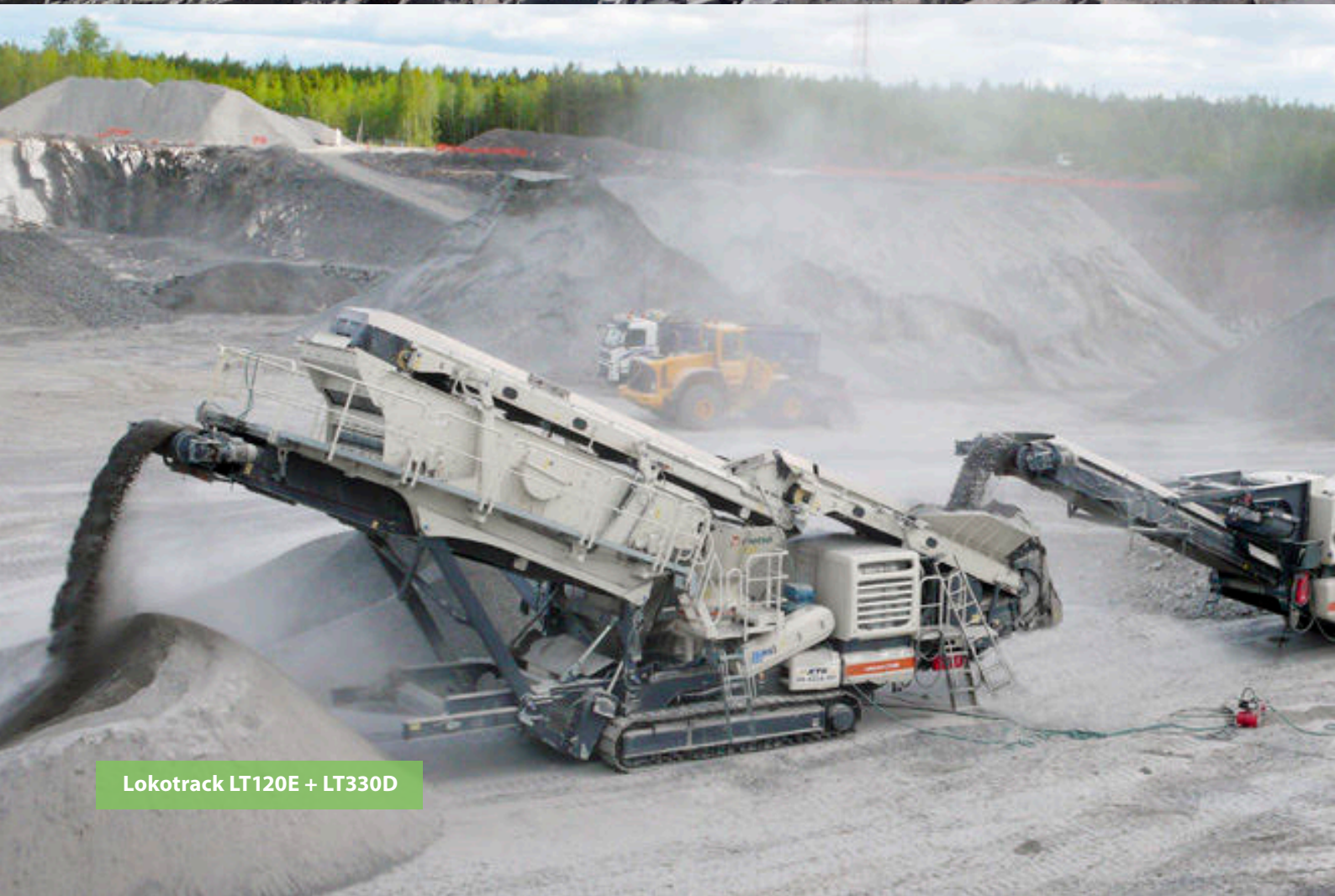
Lokotrack LT120E + LT330D