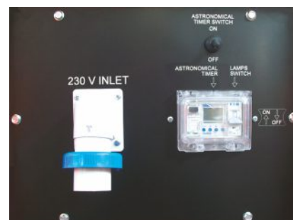
Timer astronomico digitale