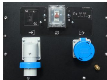
Pannello di controllo standard

La cofanatura della nuova Linktower T3 è stata disegnata in modo da proteggere meglio il pannello di controllo dalla pioggia.