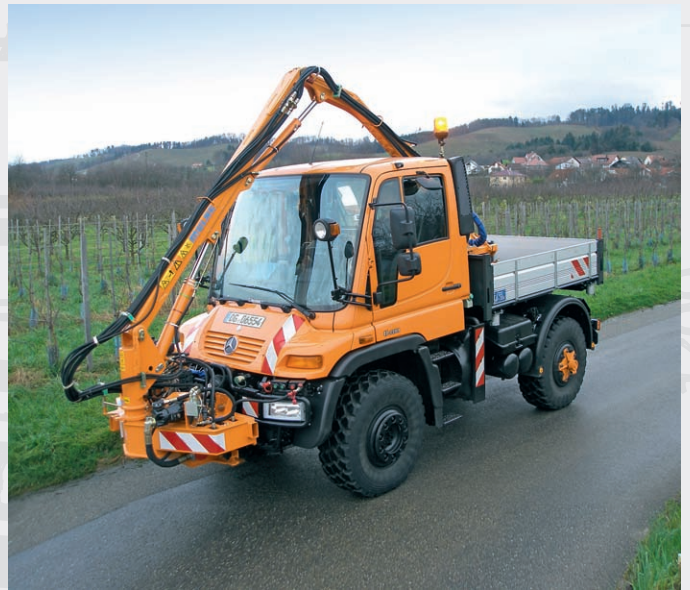
Der FME 500 in Transportstellung