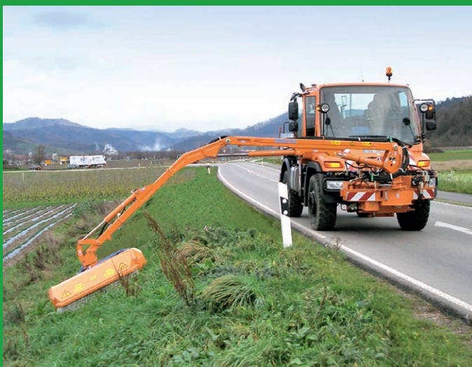
Eine große Reichweite von 6,50m erleichtert den Arbeitseinsatz