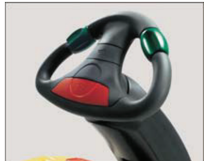
JetPilot – exklusiv bei Jungheinrich

Unterschiedliche Lenkkonzepte ermöglichen den maßgeschneiderten Einsatz: