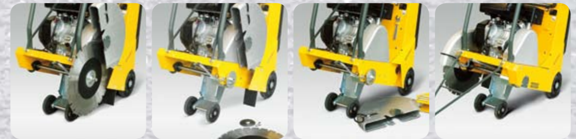
1 Zaagbeschermer omhoog klappen.

Snel wisselen van het zaagblad van linker- naar rechterzijde: