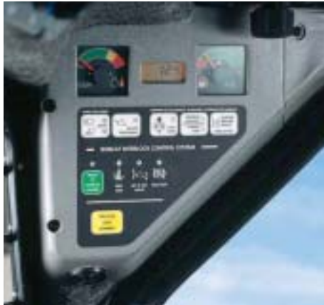
Standard-Instrumententafel an der LINKEN Seite

Der Bobcat-Lader S220 bietet eine breite Palette an innovativen, bedienungsfreundlichen Merkmalen und beeindruckenden, hochwertigen Optionen.