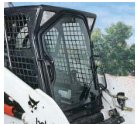
Kabine mit Klimaanlage

Der optionale, voll verstellbare Federsitz ermöglicht komfortable Bedienung ohne Ermüdung während des gesamten Arbeitstages. Der innovative Schutzbügel lässt sich von hinten absenken und hochklappen. Er bietet zusätzlichen Halt und Schutz und dient gleichzeitig als bequeme Armlehne für alle Fahrer - unabhängig von ihrer Größe.