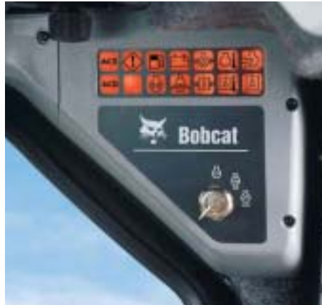
Standard-Instrumententafel an der RECHTEN Seite