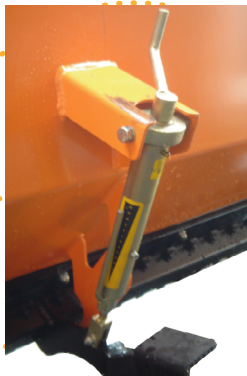
Justering af fjederbunde med tømningfunktion